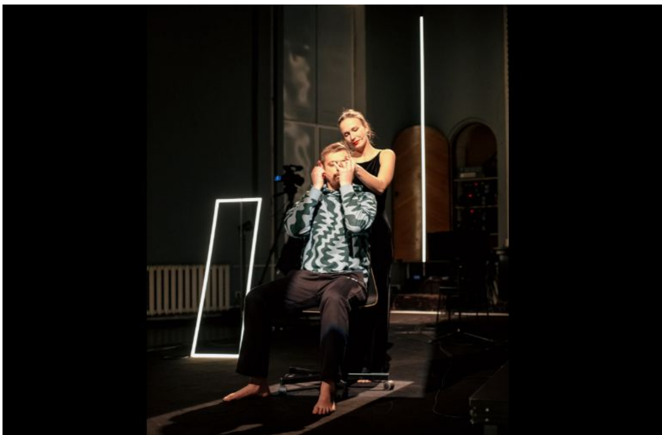
Skats no kameroperas "Kontakts"