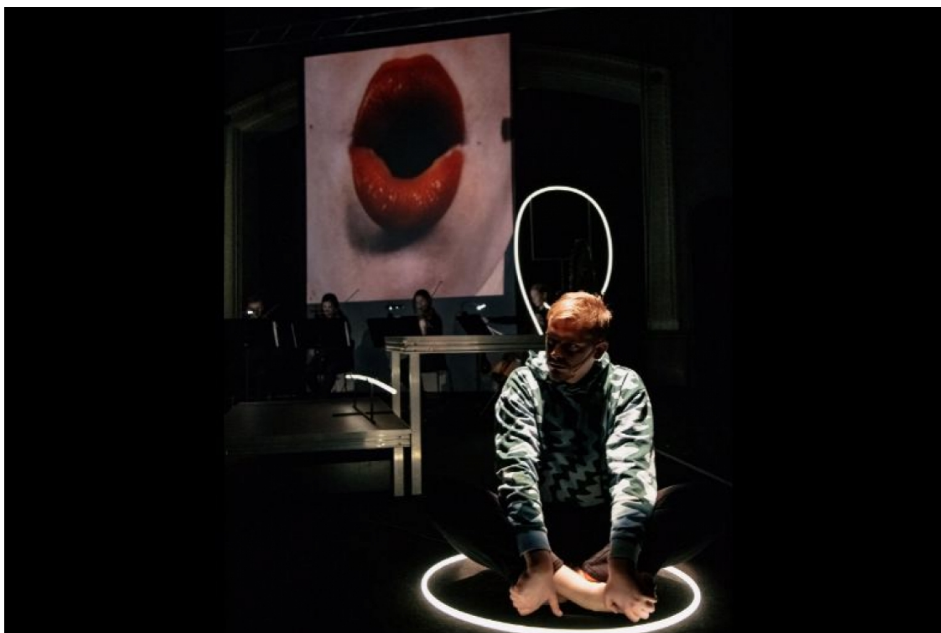
Skats no kameroperas "Kontakts" // Foto – Alvils Rolands Bijons